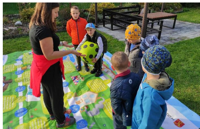
Fot. 5 Spotkanie edukacyjne w Targanicach w gminie Andrychów