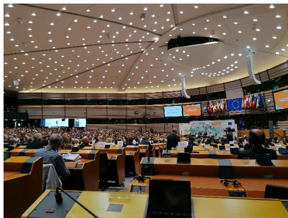
Fot. 8 Sesja otwierająca Europejski Tydzień Regionów i Miast

reprezentowali nasz region na 20. Europejskim Tygodniu Regionów i Miast #EURegionsWeek. To największe doroczne wydarzenie poświęcone polityce regionalnej, w którym udział biorą tysiące uczestników z całej UE. Główną konferencją, podzieloną na panele tematyczne, towarzyszą spotkania, wystawy i wydarzenia służące nawiązywaniu kontaktów w zakresie rozwoju regionalnego i lokalnego. Tematyka tegorocznej edycji Europejskiego Tygodnia Regionów i Miast obejmowała m. in. transformację ekologiczną i cyfrową.