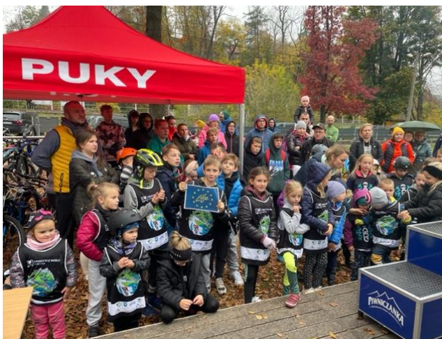
Fot. 7 Rowerowa jesień w gminie Piwniczna-Zdrój