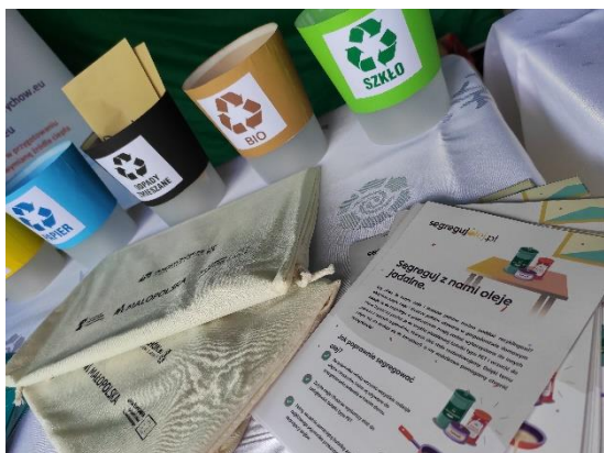
Fot. 2 Materiały edukacyjne