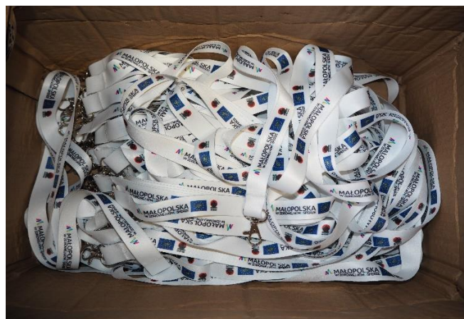
Fot. 4 Materiały promocyjne