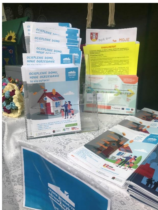
Fot. 3 Ulotki i broszury