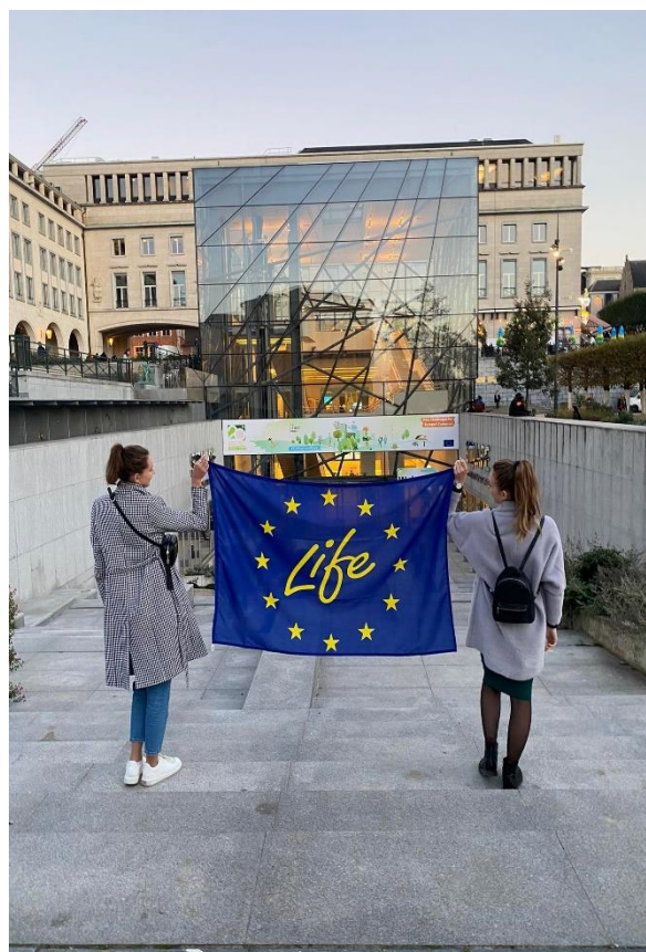
Fot. 9 Promocja projektu LIFE podczas Europejskiego Tygodnia Regionów i Miast