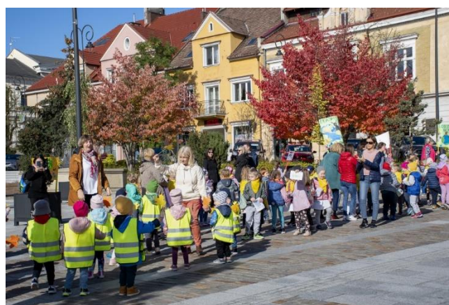
Fot. 6 Happening „Czyste powietrze wokół nas” w gminie Myślenice