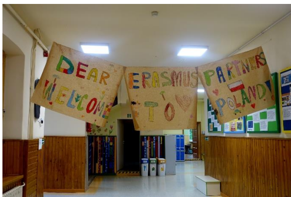
Fot. 10 Promocja realizacji projektu LIFE