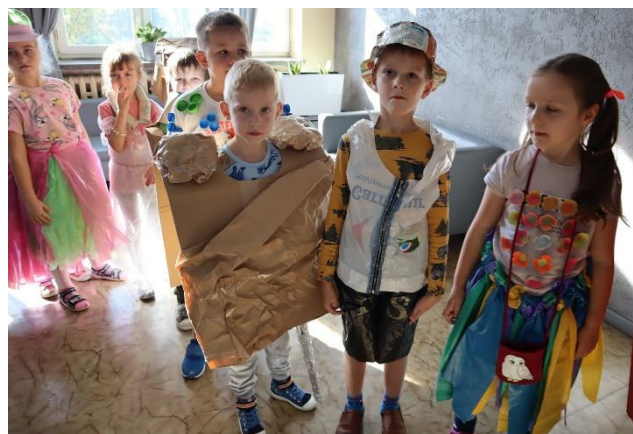
Fot. 10 Zajęcia w przedszkolu w gminie Słomniki