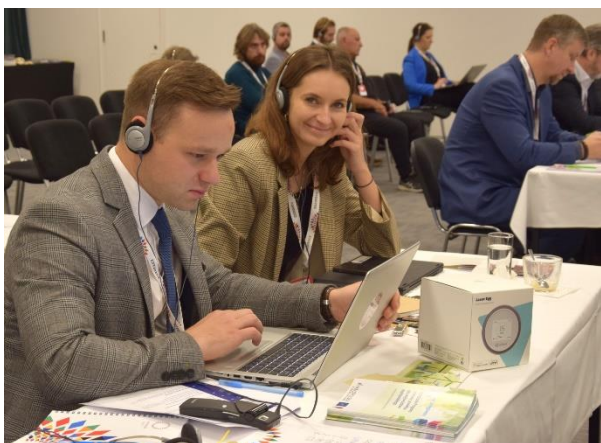
Fot. 11 Air Quality Conference