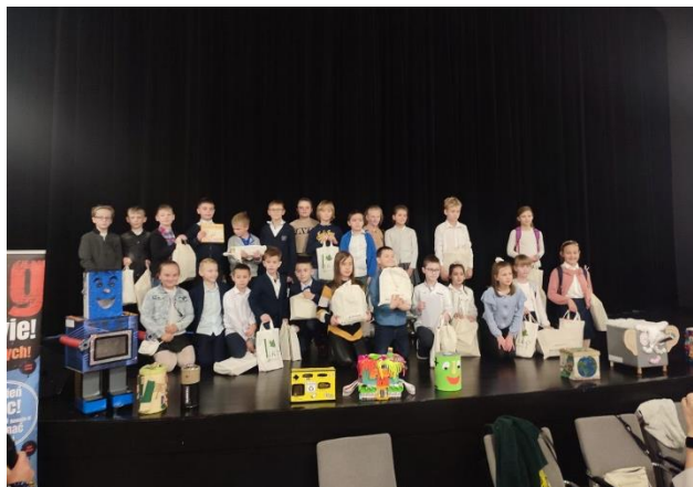
Fot. 7 Konkurs ekologiczny w gminie Andrychów