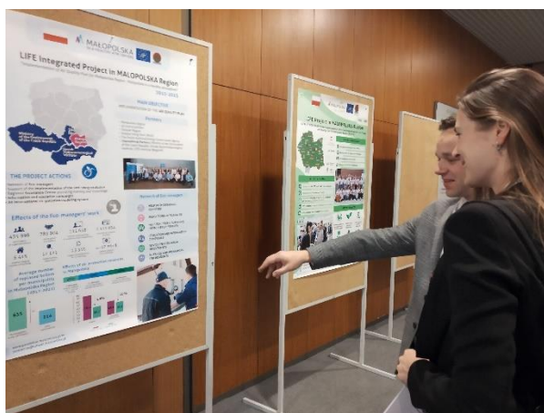
Fot. 12 Sesja posterowa podczas Air Quality Conference