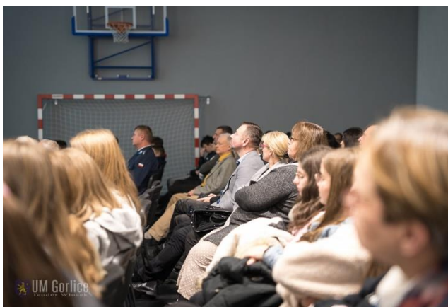
Fot. 8 Konferencja pn „Punkt krytyczny – ochrona powietrza i zmiany klimatu w dobie kryzysu energetycznego” w Gorlicach