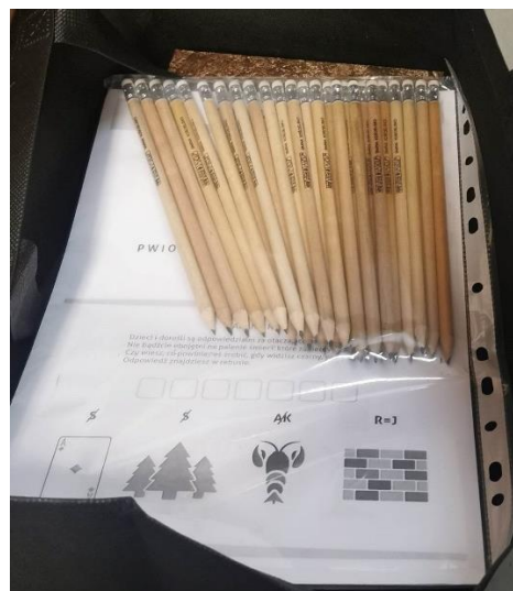
Fot. 4 Materiały edukacyjne