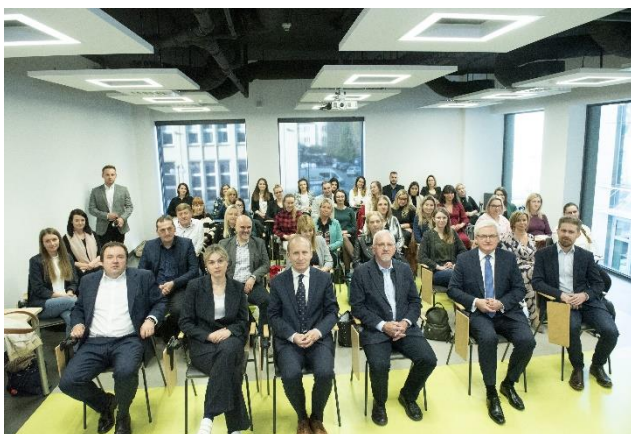
Fot. 3 Inauguracja trzeciej edycji studiów podyplomowych