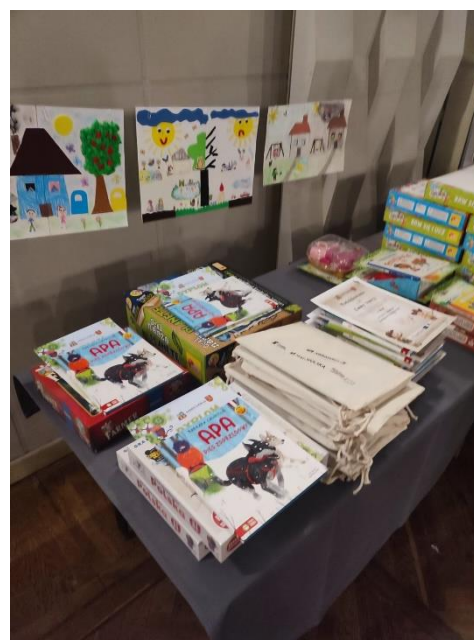
Fot. 6 Materiały promocyjne