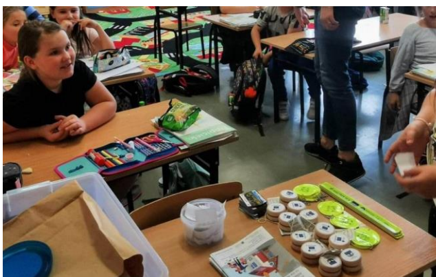
Fot. 9 Dzień czystego powietrza w gminie Radziewicz