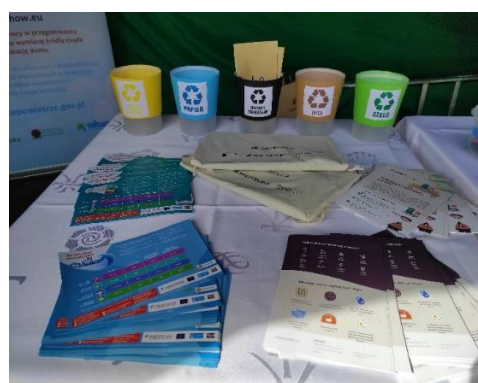
Fot. 5 Ulotki i broszury