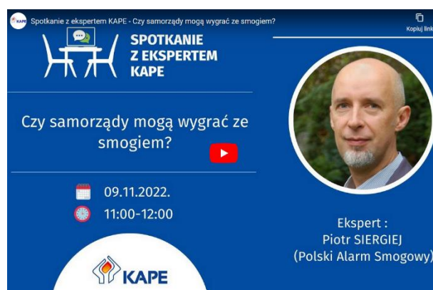
Fot. 1 Spotkanie z Ekspertem KAPE