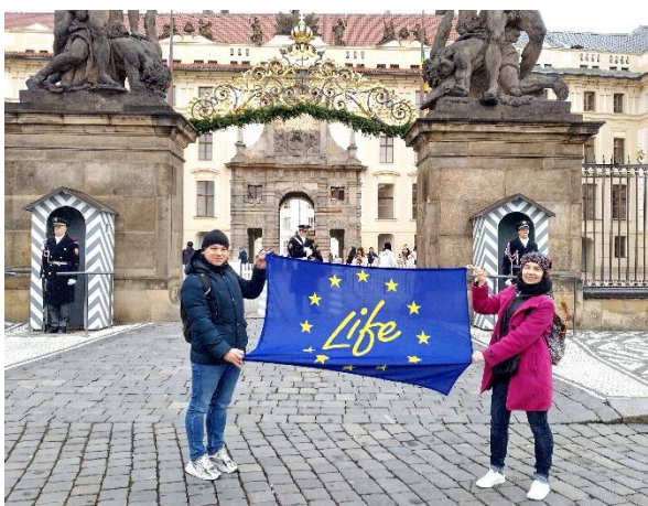
Fot. 13 Promocja Projektu LIFE podczas Air Quality Conference