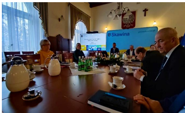
Fot. 13 Spotkanie przedstawicieli instytucji ochrony środowiska w Skawinie