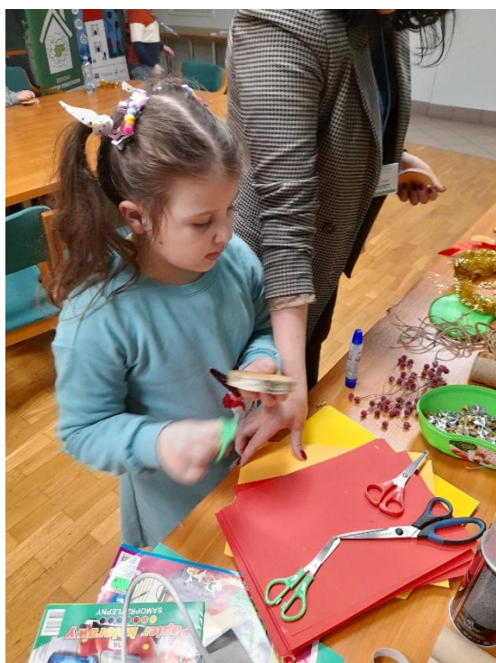
Fot. 9 Warsztaty ekologiczne „Cały świat jest w waszych rękach – co może mały człowiek” w gminie Czernichów