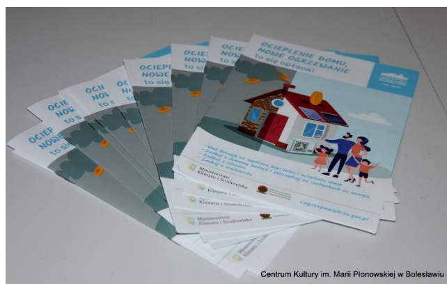
Fot. 6 Ulotki i broszury