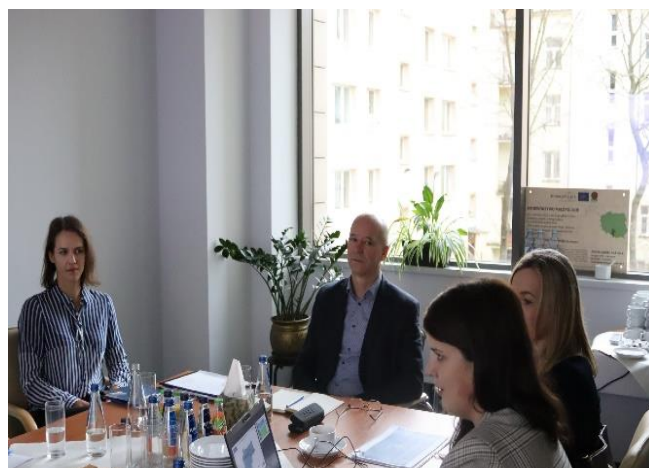
Fot. 16 Wizyta monitorująca- spotkanie z partnerem miastem Kraków