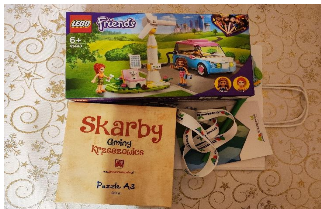
Fot. 7 Materiały promocyjne