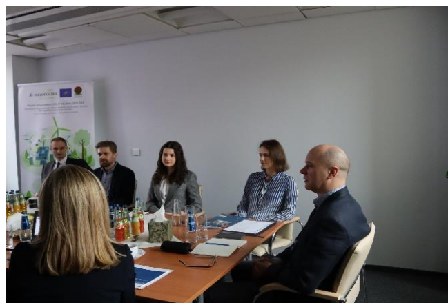
Fot. 14 Wizyta monitorująca

przedstawicielami gmin partnerskich tj. Bochni oraz Wierzchosławic.