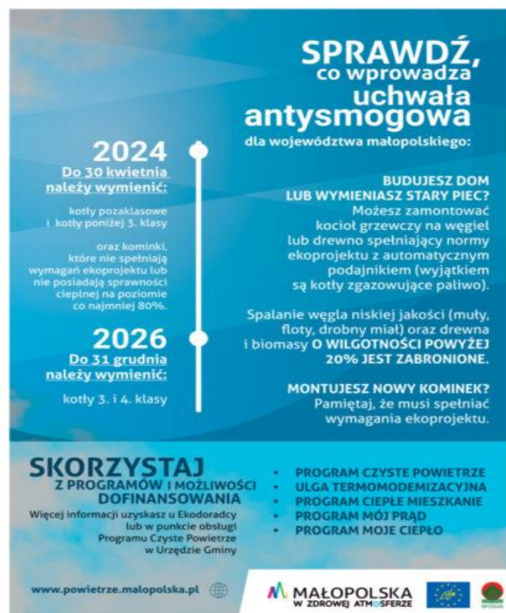
Fot. 5 Materiały edukacyjne