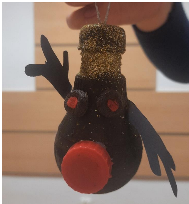
Fot. 11 Konkurs na eko-ozdobę choinkową w gminie Szczurowa