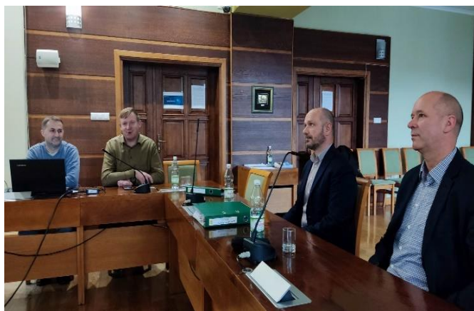
Fot. 17 Wizyta monitorująca- spotkanie z partnerem miastem Bochnia