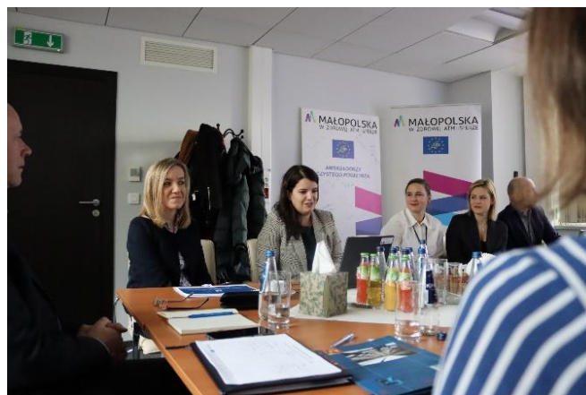
Fot. 15 Wizyta monitorująca- spotkanie z partnerem miastem Kraków