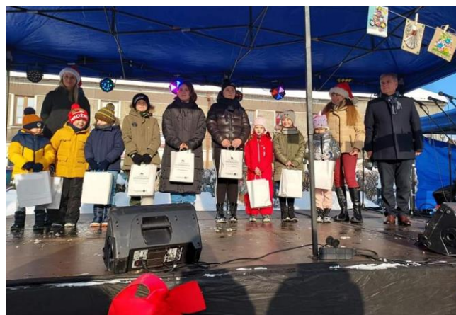
Fot. 10 Konkurs Ekokartka „Dbam o czyste powietrze nie tylko od święta” w gminie Krzeszowice