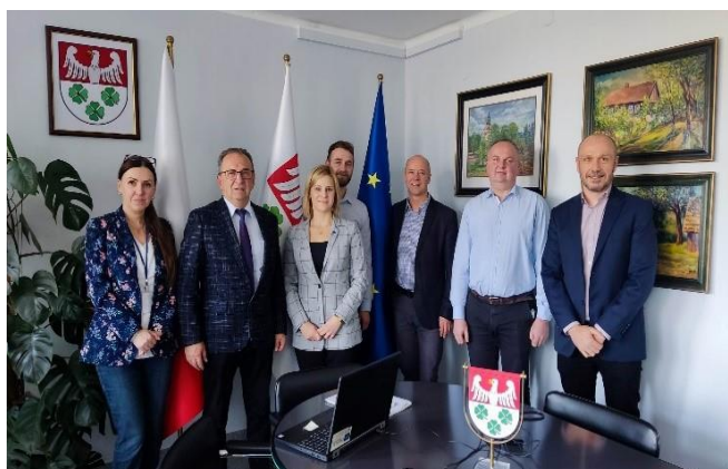
Fot. 18 Wizyta monitorująca- spotkanie z partnerem gmina Wierzchosławice