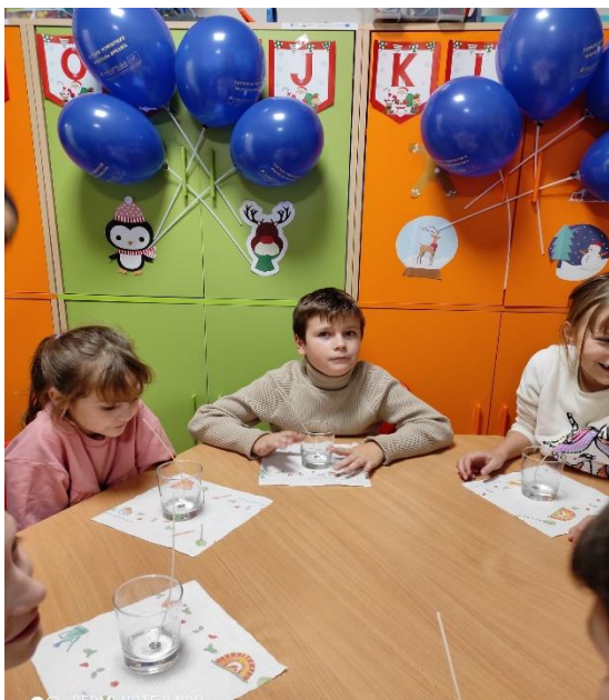
Fot. 8 Warsztaty z wykonywania świec w gminie Bolesław