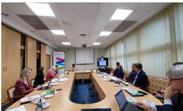
Fot. 12 Posiedzenie zespołu ds. energetyki i klimatu WRDS