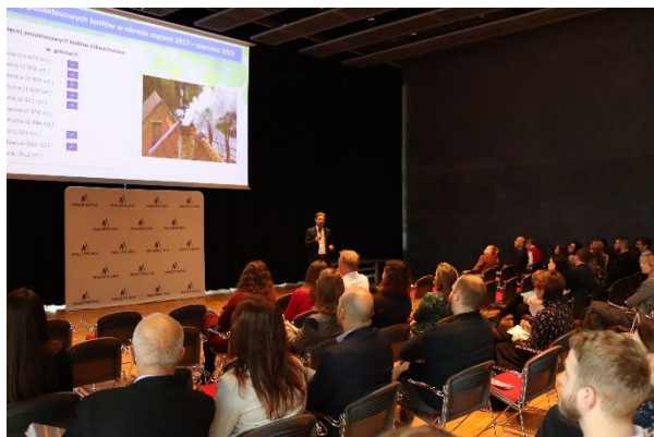
Fot. 2 Spotkanie dotyczące ewaluacji POP-u

tów takich jak: gminy, starostwa, jednostki naukowe czy przedsiębiorstwa. Druga część spotkania miała charakter warsztatowy. Uczestników warsztatów podzielono na 8 grup. Każdy z zespołów podjął wyzwanie opracowania rozwiązań, które mogłyby usprawnić działania w obszarach związanych z poprawą jakości powietrza.