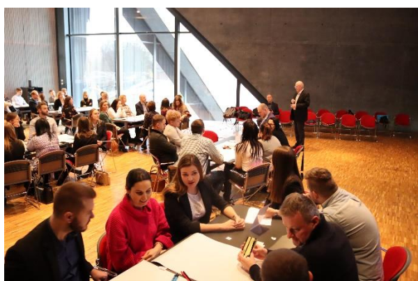
Fot. 3 Praca warsztatowa Ekodoradców