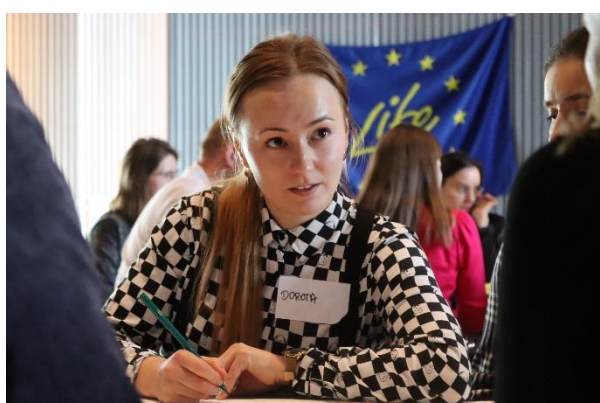
Fot. 4 Praca warsztatowa Ekodoradców