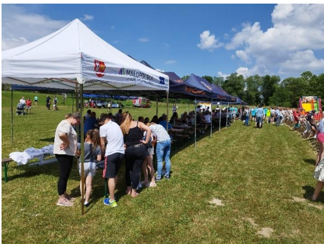
Fot. 8 Piknik ekologiczny w gminie Tomice