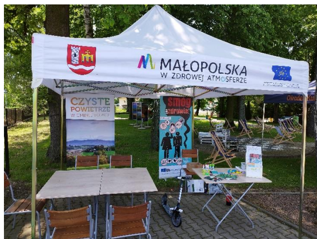
Fot. 4 Stanowisko promocyjne LIFE