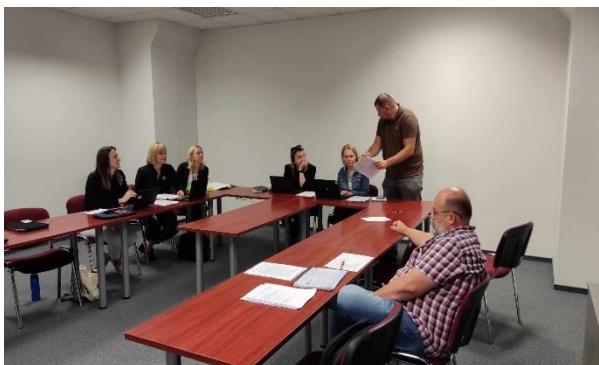
Fot. 2 Spotkanie robocze wnioskodawców programu FE 2021-2027