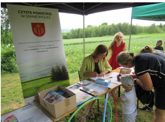
Fot. 9 Piknik w gminie Ryglice