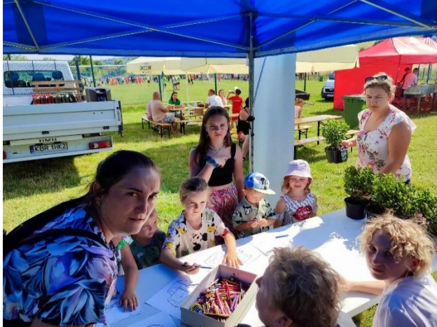
Fot. 7 Ekopiknik w gminie Iwkowa