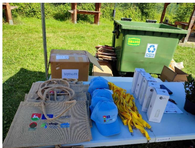
Fot. 6 Materiały promocyjne