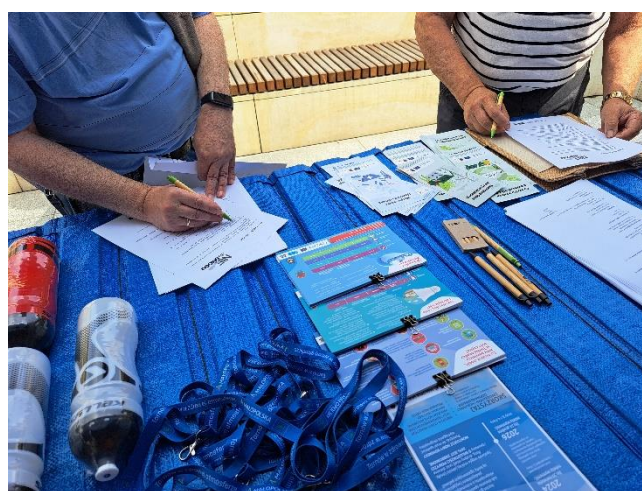
Fot. 5 Ulotki i broszury