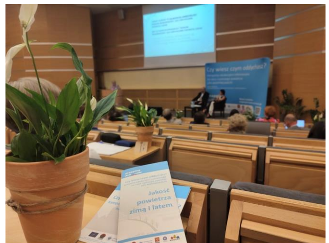
Fot. 10 Konferencja Naukowa „Jakość powietrza a zdrowie”