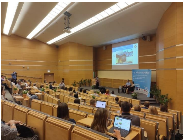
Fot. 11 Konferencja Naukowa „Jakość powietrza a zdrowie”

Dokument powstał jako realizacja działania F1 projektu LIFE MAŁOPOLSKA „Wdrażanie Programu ochrony powietrza dla województwa małopolskiego – Małopolska w zdrowej atmosferze” (LIFE-IP MALOPOLSKA / LIFE14 IPE PL 021) dofinansowanego ze środków programu LIFE Unii Europejskiej oraz Narodowego Funduszu Ochrony Środowiska i Gospodarki Wodnej. Podsumowanie przedstawia wyłącznie poglądy autorów, a Komisja Europejska i NFOŚiGW nie ponoszą odpowiedzialności za żadne ewentualne wykorzystanie zawartych w nim informacji.