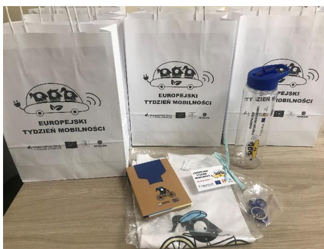
Fot.7 Materiały edukacyjne