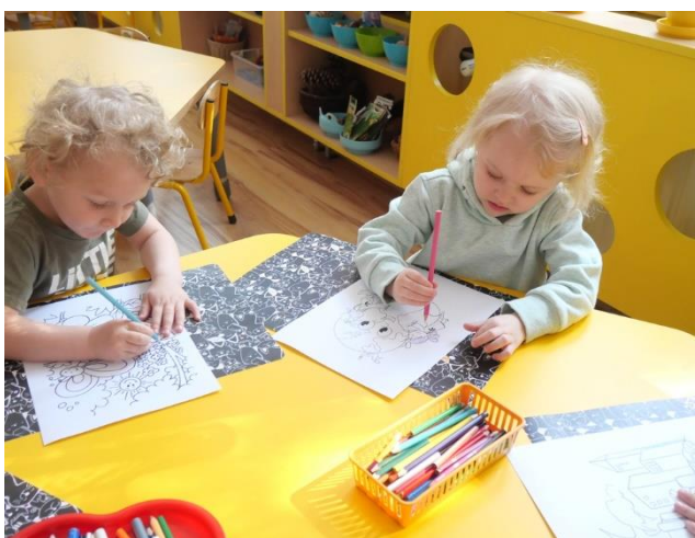
Fot. 12 Edukacja ekologiczna w Tarnowie