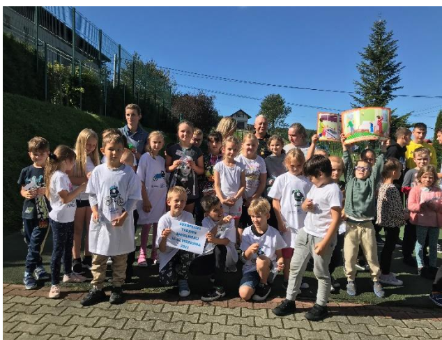
Fot. 11 Prelekcje w ramach Europejskiego Tygodnia Mobilności w gminie Nawojowa