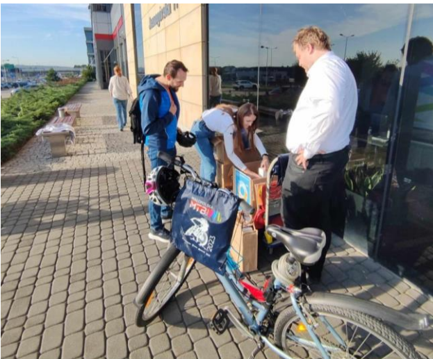
Fot. 15 Dzień bez samochodu