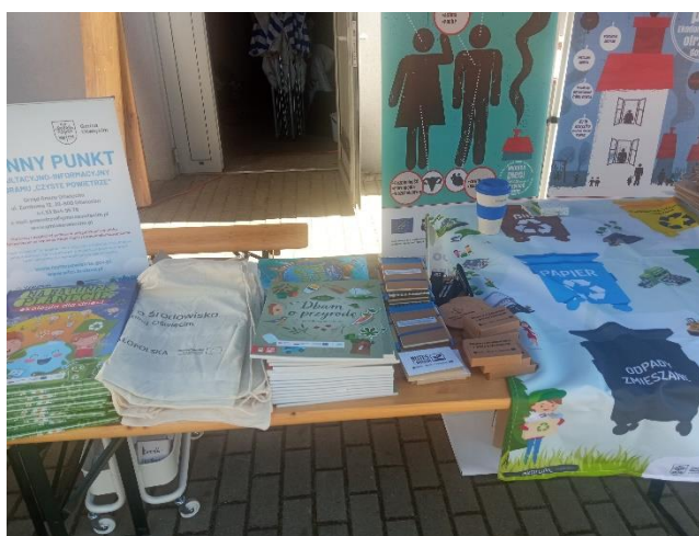
Fot.6 Ulotki i broszury