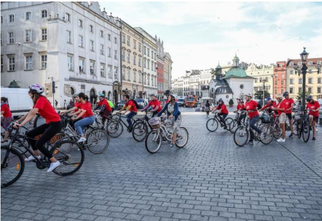
Fot. 14 Przejazd pracowników UMWM