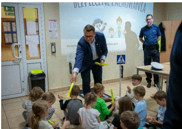
Fot.10 Spotkanie pn. „Myślenie opowiadają, jak ekologicznie się przemieszczają – dzień transportu niskoemisyjnego”