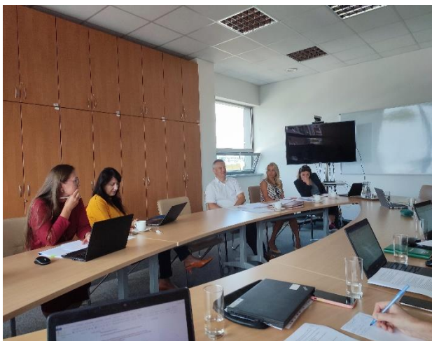
Fot. 2 Spotkanie robocze dotyczące założeń programu FEM 2021-2027