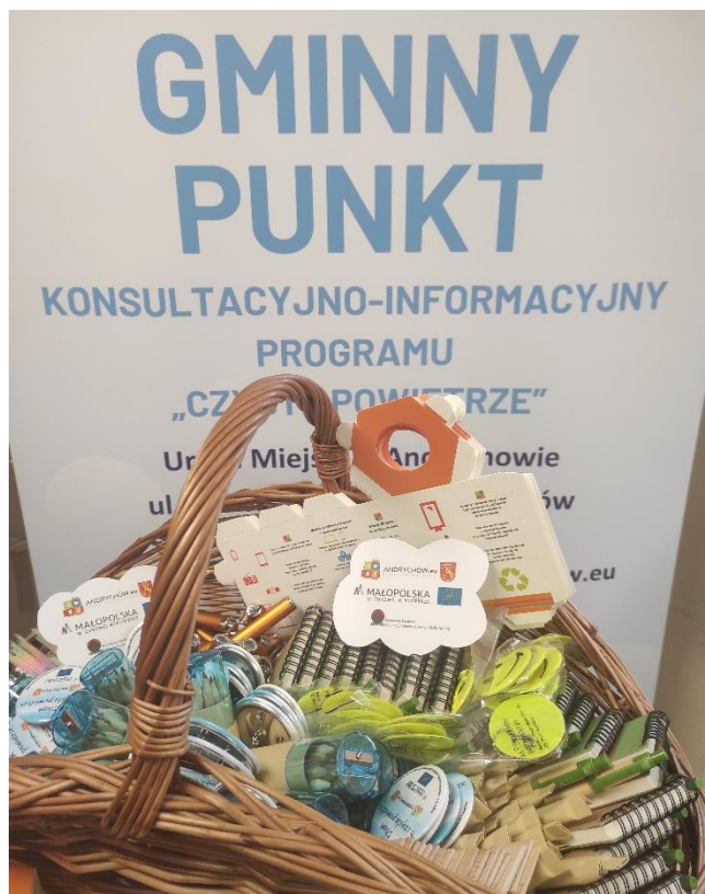
Fot. 8 Materiały promocyjne