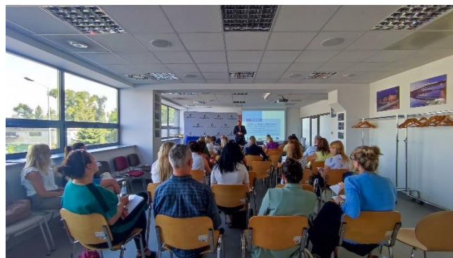
Fot. 3 Uczestnicy szkolenia nt. dofinansowanie funkcjonowania ekodoradców w gminach