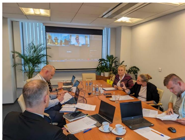
Fot. 4 Spotkanie z Wojewódzkim Funduszem Ochrony Środowiska i Gospodarki Wodnej