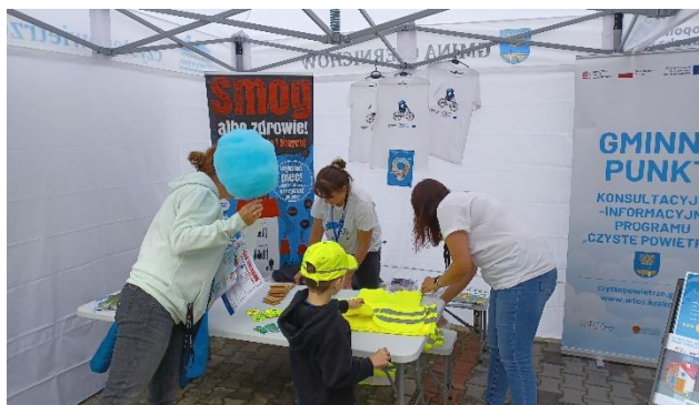
Fot.5 Stanowisko promocyjne LIFE

z programem Czyste Powietrze , gry planszowe i materiały szkolne dla dzieci).