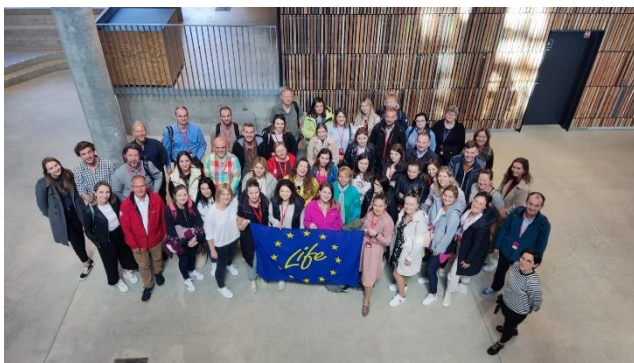
Fot. 12 Wizyta w Urzędzie Miasta Aarhus