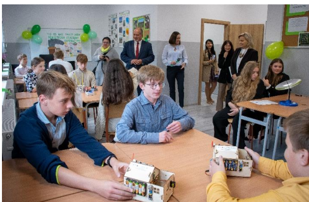
Fot. 7 Ekolekcje w gminie Myślenice