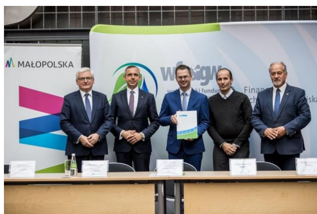
Fot. 15 Przedstawiciele partnerskich gmin