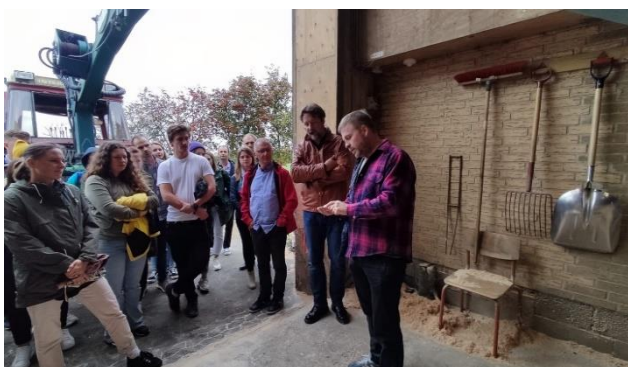
Fot. 11 Wizyta w Føns Nærværme