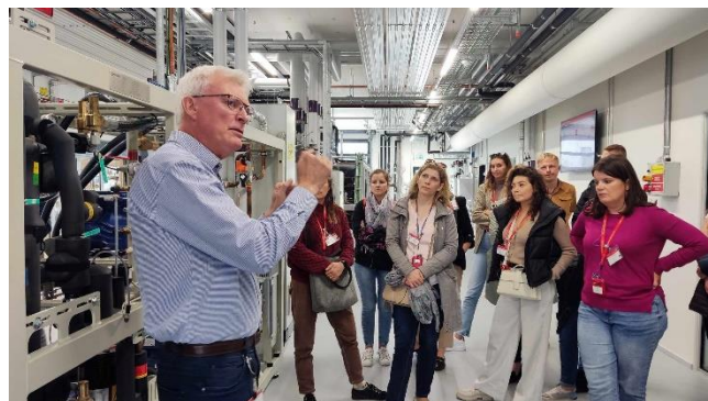
Fot. 9 Wizyta w siedzibie firmy Danfoss