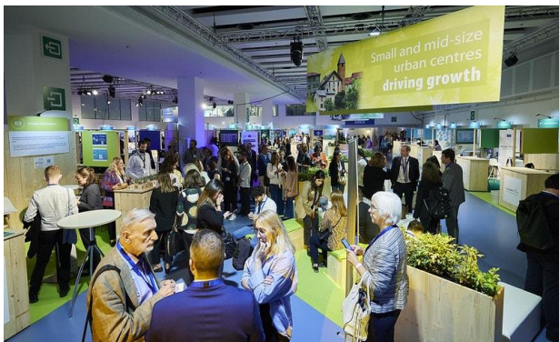
Fot. 16 Wystawy w Agora Village

cieli Projektu LIFE MAŁOPOLSKA, którzy uczestniczyli w panelach dotyczących obszarów związanych z poprawą jakości powietrza, ochroną klimatu i adaptacją do życia w zmieniających się warunkach.