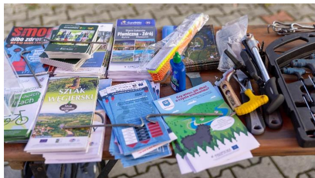
Fot.3 Ulotki i broszury