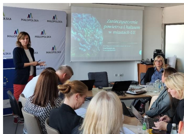
Fot. 21 Kontrola ETO