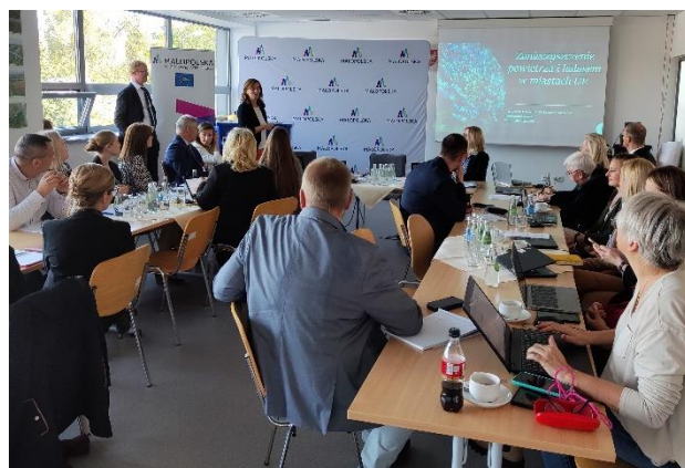
Fot. 19 Kontrola ETO