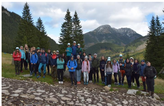
Fot. 6 Ekorajd w gminie Kościelisko