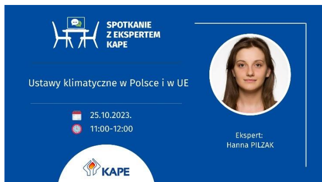
Fot. 2 Spotkanie z ekspertem KAPE

25.10 - „Ustawy klimatyczne w Polsce i w UE”,