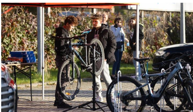
Fot. 8 Ekologiczny piknik rowerowy w gminie Piwniczna