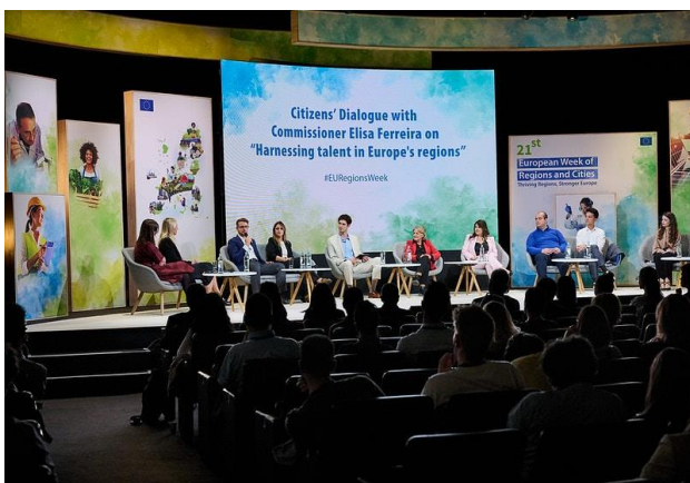
Fot. 17 Konferencja Citizens' Dialogue