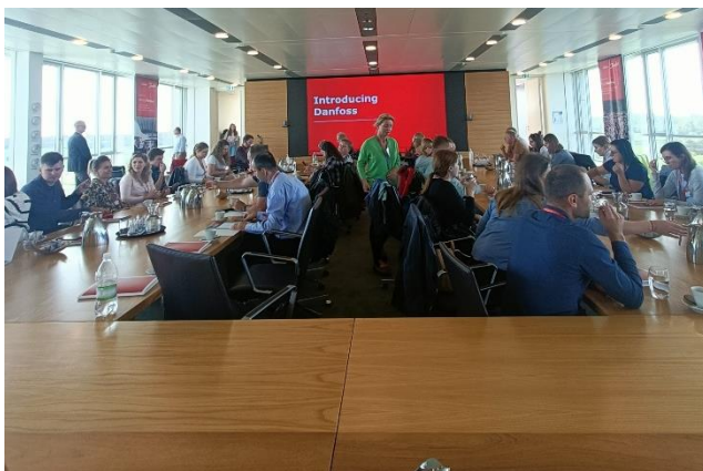
Fot. 10 Wizyta w siedzibie firmy Danfoss