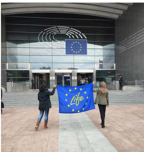
Fot. 18 Przedstawiciele Projektów LIFE