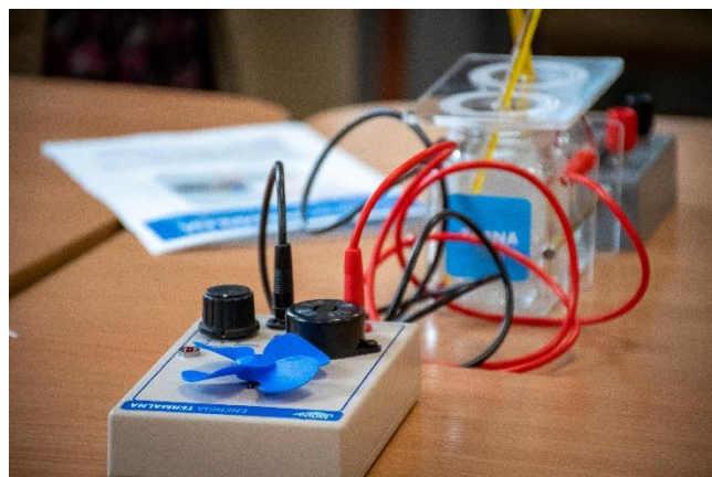
Fot.5 Materiały edukacyjne