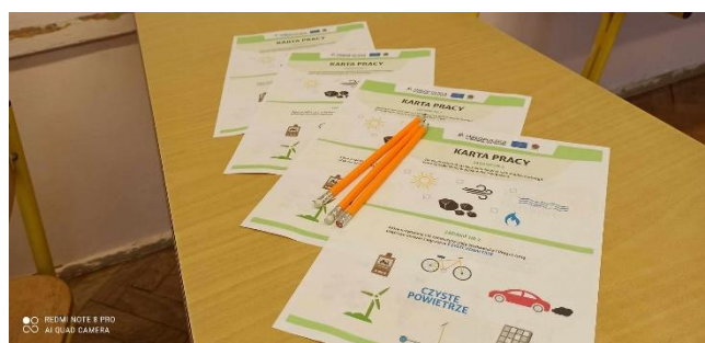
Fot.4 Materiały edukacyjne