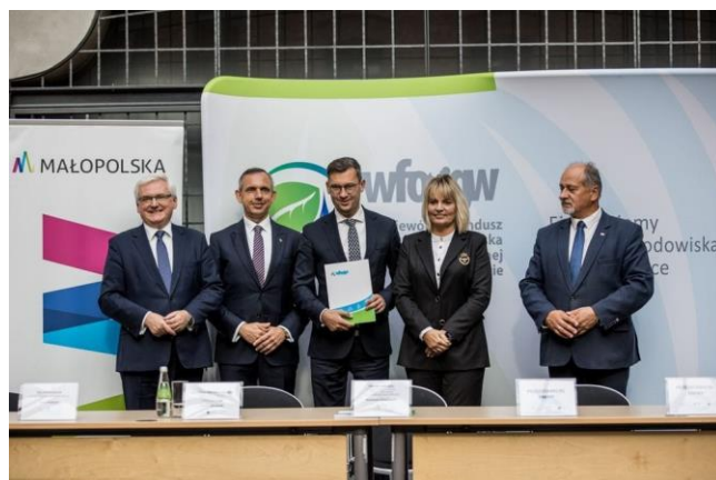
Fot. 14 Przedstawiciele partnerskich gmin