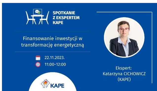
Fot. 2 Spotkanie z ekspertem KAPE

22.11 - „Finansowanie inwestycji w transformację energetyczną”,