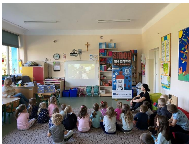
Fot.7 Dzień Czystego Powietrza w gminie Radziemice