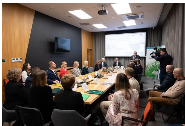
Fot. 10 Podpisanie umów z operatorami