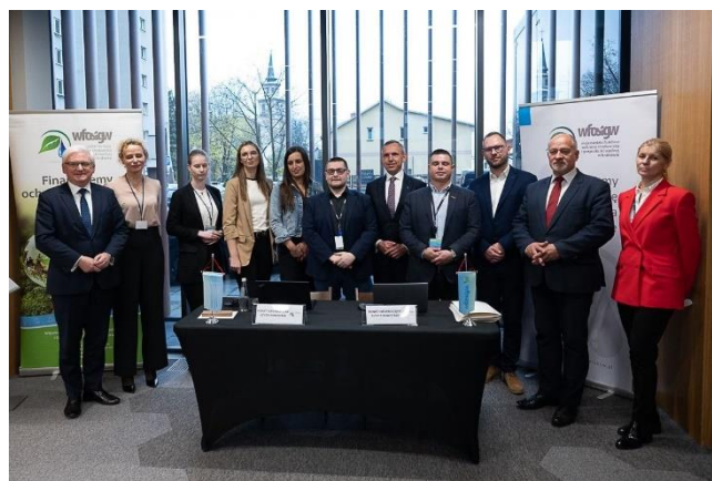
Fot. 11 Operatorzy w programie „Czyste Powietrze”