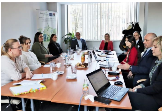
Fot. 13 Spotkanie z województwem podkarpackim