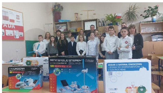
Fot.6 Materiały edukacyjne