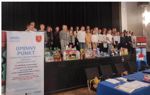
Fot. 9 Gminny konkurs ekologiczny w Andrychowie