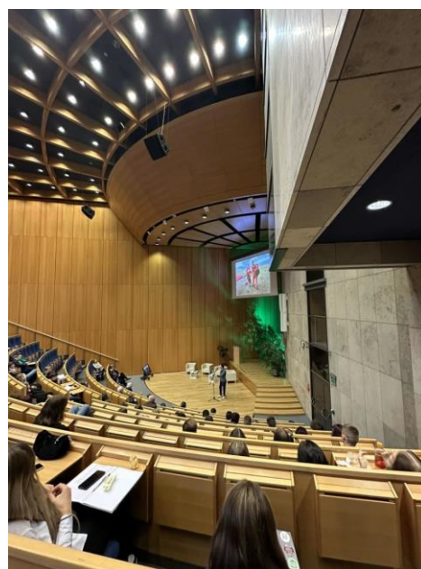
Fot. 4 Uczestnicy konferencji Eco Kongres