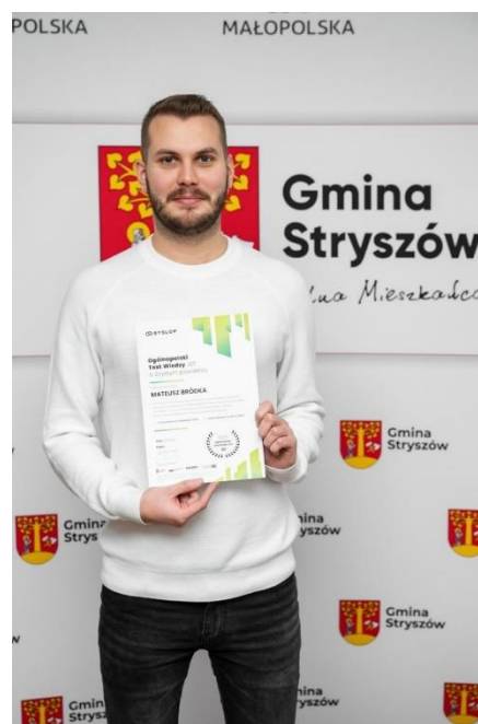
Fot. 11 Ekodoradca gminy Stryszów