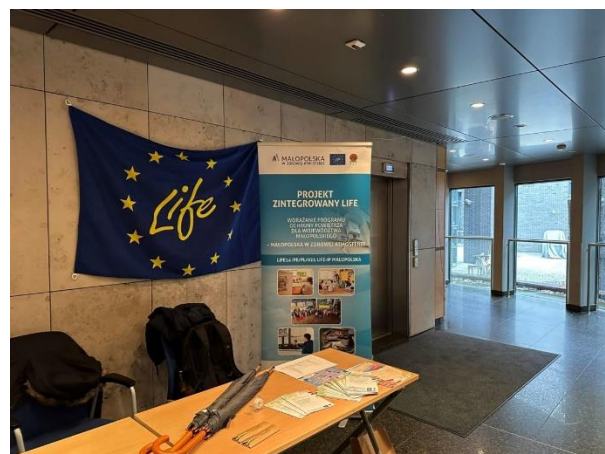
Fot. 3 Stoisko Projektu LIFE podczas Eco Kongresu