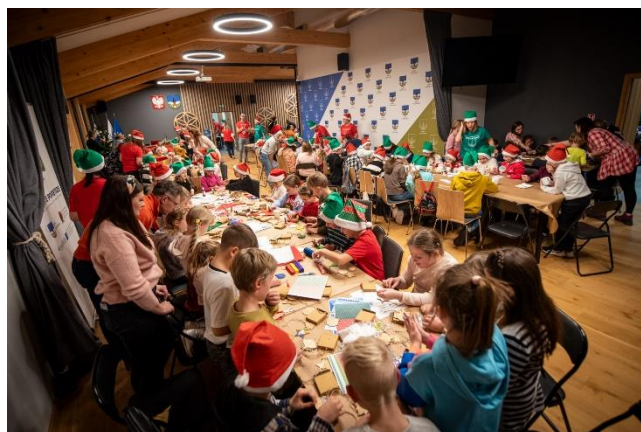
Fot. 9 Warsztaty Ekochoinka w gminie Kościelisko