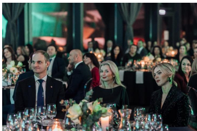
Fot. 17 Zaproszeni goście