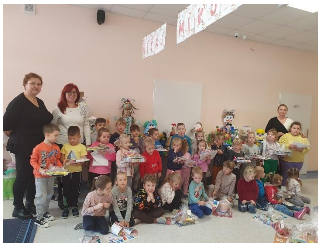
Fot. 8 Konkurs ekologiczny w gminie Gromnik