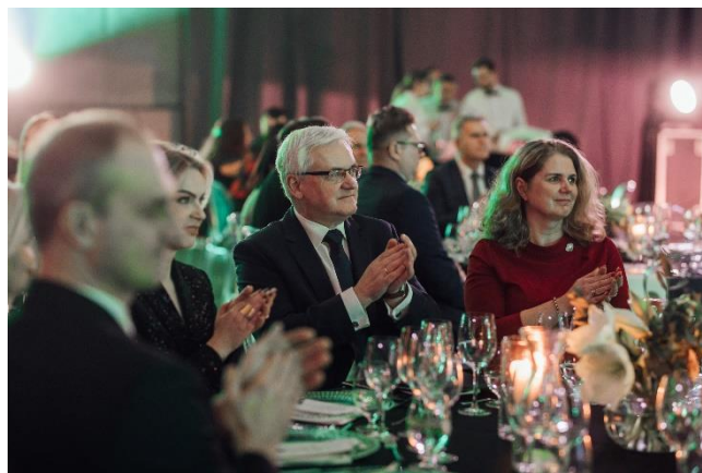
Fot. 15 Zaproszeni goście