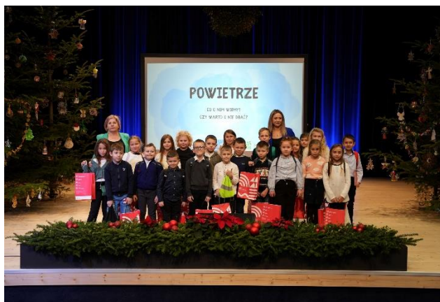
Fot.6 Konkurs Ekozdoba choinkowa w gminie Ciężkowice