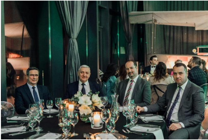
Fot. 18 Zaproszeni goście