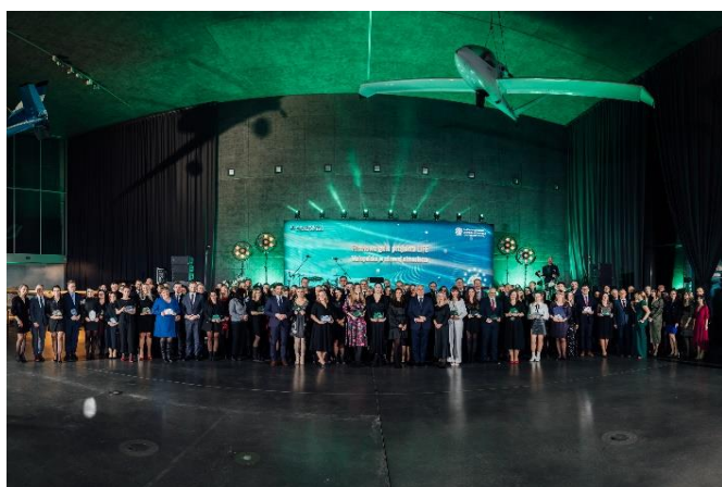
Fot. 13 Uczestnicy Gali finałowej

Nagroda specjalna Clean Air Champion dla Krakowa za szereg działań w walce o czyste powietrze: m.in. skuteczne wdrażanie programu ochrony powietrza, uchwały antysmogowej, przyjęcie pierwszej w Polsce strefy czystego transportu.