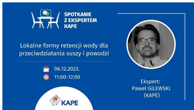
Fot. 2 Spotkanie z ekspertem KAPE

6.12 - „Lokalne formy retencji wody dla przeciwdziałania suszy i powodzi”, 20.12 - „Samorzędy vs. Atom. Co można zyskać, a co stracić na budowie elektrowni jądrowej?”