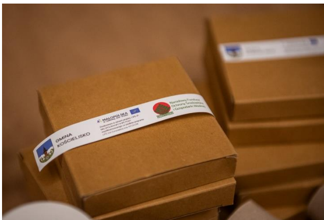
Fot.5 Materiały edukacyjne