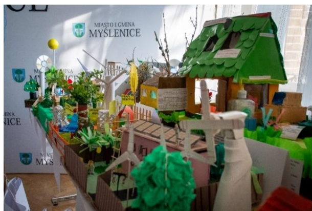
Fot.7 OZE i ich wpływ na środowisko w gminie Myślenice