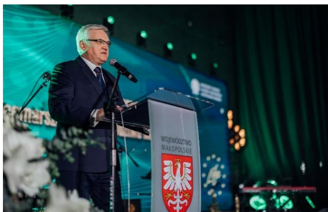
Fot. 14 Wystąpienie Józefa Gawrona- Wicemarszałka Województwa Małopolskiego