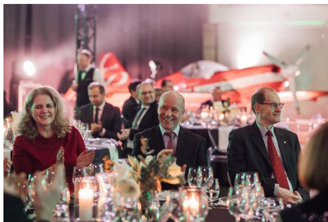
Fot. 16 Zaproszeni goście