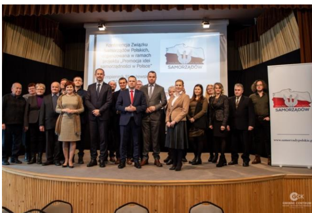
Fot. 10 Uczestnicy konferencji